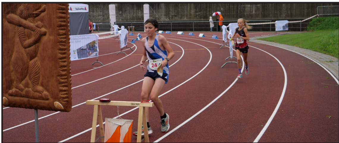
Am Sonntag stand der Sportplatz Wühre im Zentrum des Staffellaufs