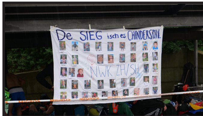
Gesamtrangliste Jugendcup 2023