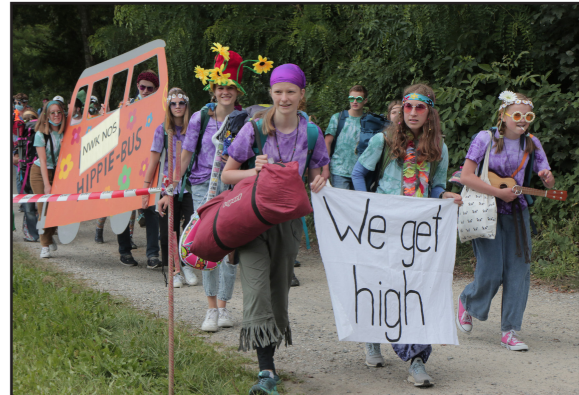
«We get high - Hippies» NWK NOS