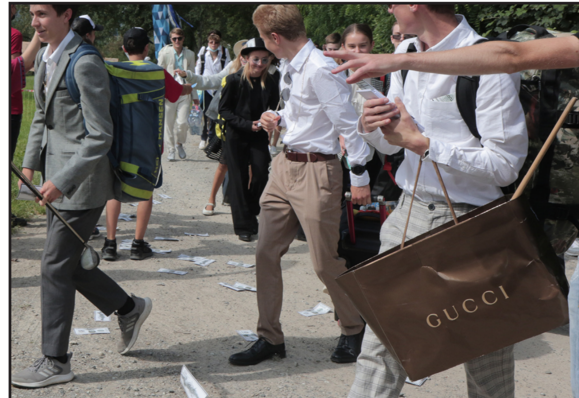
«Arrogant, guet ussehend, erfolgreich - Züri Snobs» NWK ZH/SH