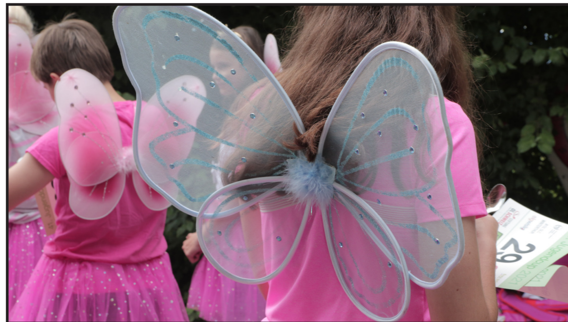
«Mit viel Pink und Glitzer simmer die grösste Flitzer - Prinzessin Lillifee» ZesOLNak und NWK GR/GL

Hier ein kleiner Einblick in die Mottos der Nachwuchskader: